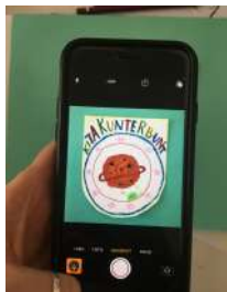
Logo auf farbigem Hintergrund fotografiert und quadratisch zugeschnitten.