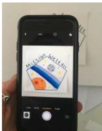
Logo quadratisch fotografiert.